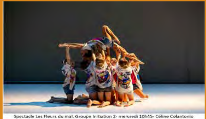
Spectacle Les Fleurs du mal, Groupe Initiation 2- mercredi 10h45- Céline Colantonio

Depuis de nombreuses années, Céline Colantonio présente ses élèves aux concours prestigieux comme, par exemple, le « Concours National de Danse », avec des groupes, des solos ou encore des duos.